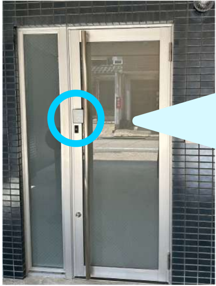
正面玄関横に スマートロックがあります。